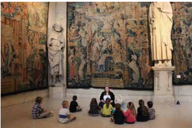
Au fil du Palais du Tau (Grand Est)