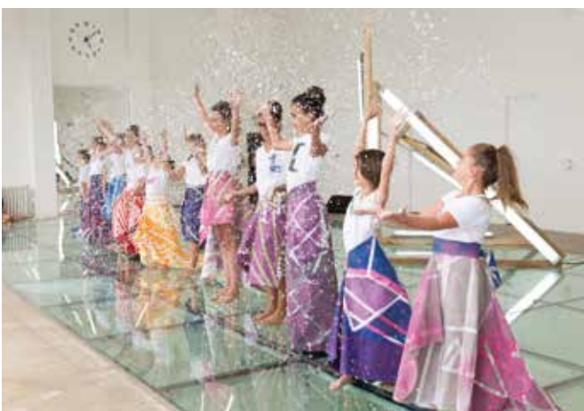
Villa Noailles, Hyères 2016 © Villa Noailles (Provence-Alpes Côte d'Azur)