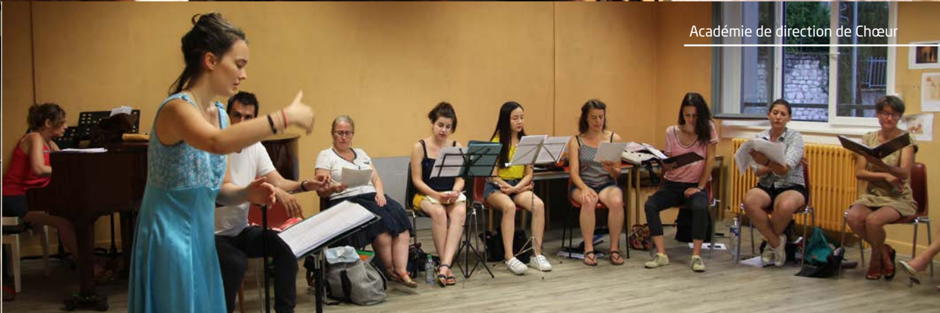
Académie de direction de Chœur