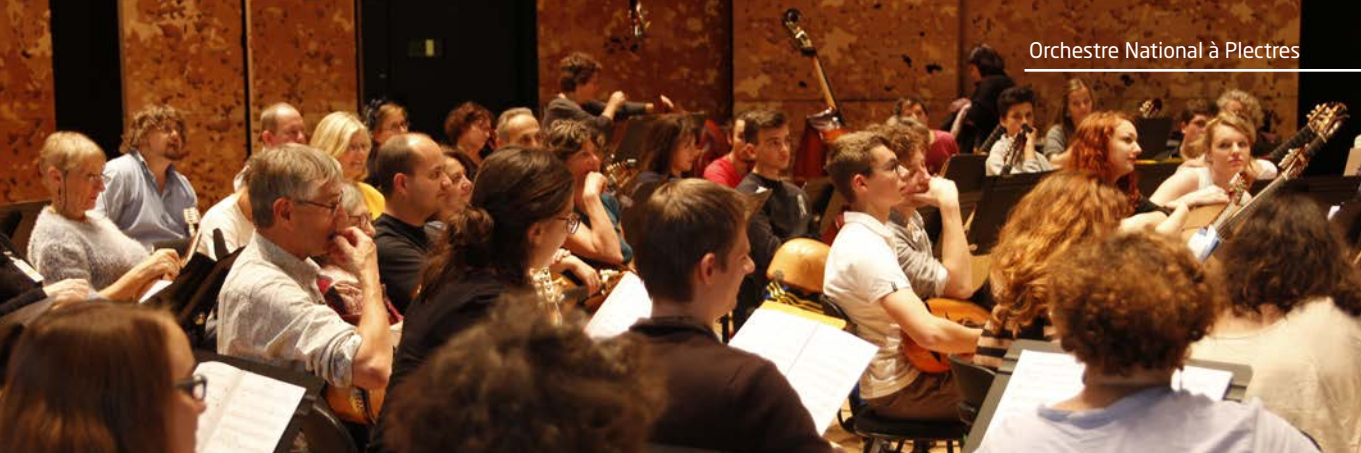
Orchestre National à Plectres